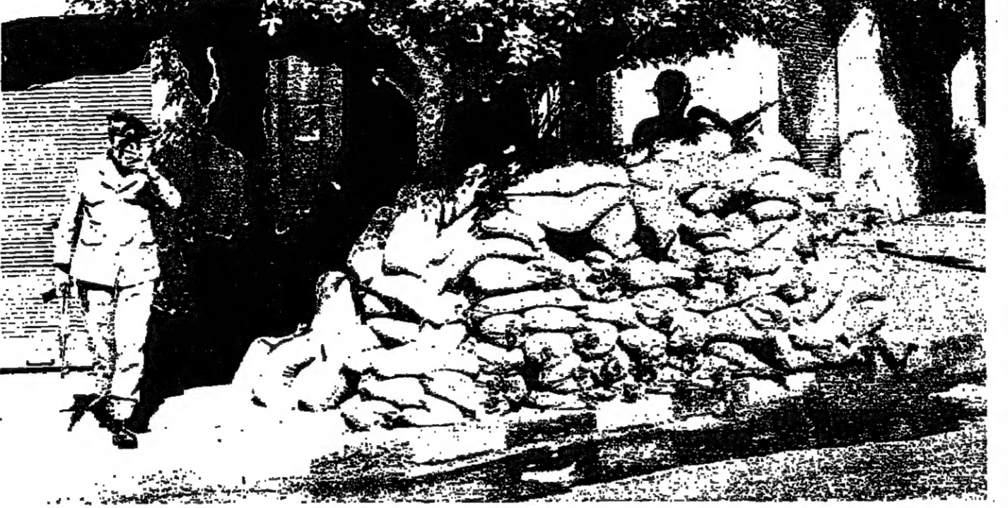
تترامس لتوي الامن في استخبارات بيروت امس

حرب الفصل الاول تتروى في الداخل والخارج بضمون امامهم خريطة لبنان ويحزون نورها حدود التقسيم على مزاجهم. وكل يوم ينظر موقع التقسيم على الخريطة . وكل يوم يجري الحديث عن مخطط جديد ، او عن شكل جديد للمخطط القديم . بل ان هناك من يوسع البكار ، ويضع امامه خريطة الخطة العربية ، ثم يبدأ برسم الدويلات والحدود .